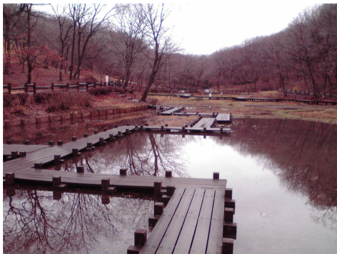
写真1 湿性生態園の木板の通路(通行禁止)